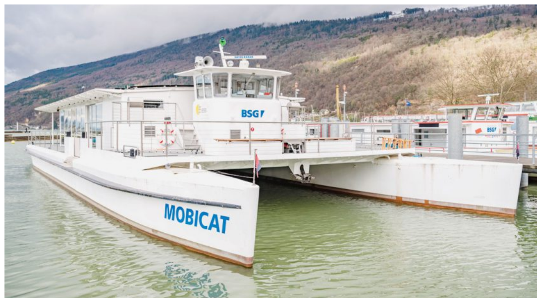
La saison estivale de la BSG commence dimanche avec un brunch sur le catamaran solaire MobiCat.

En raison des mesures de protection liées au coronavirus, le nombre de places à bord est toutefois limité. Les coordonnées de tous les passagers sont répertoriées et serviront à retracer les chaînes de transmission. «Afin d'éviter au maximum de longues attentes lors de l'embarquement, nous prions nos clients d'apporter la feuille de données