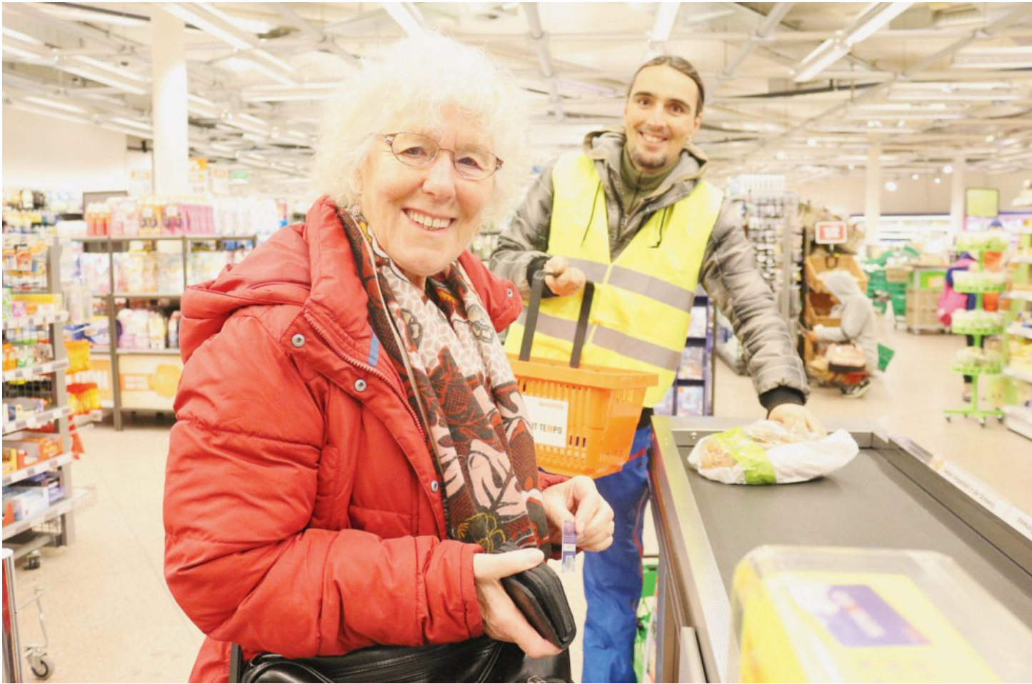
L'un des objectifs du projet «Wili», outre l'aide aux personnes âgées, est de favoriser l'intégration professionnelle des participants. LDD

Il a réussi à convaincre tout le monde, «Wili». Lancé en avril 2017 à la Migros de la place Guisan, le service d'accompagnement des personnes âgées lors de leurs achats a gagné le droit de s'étendre à trois autres établissements du géant orange: depuis hier, il est aussi disponible dans les filiales de Boujean, de Madretsch et du Marché-Neuf.