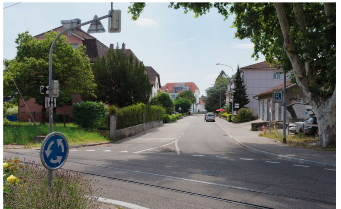
La construction de la branche Ouest bouleversera la rue Gurnigel. RAPHAEL SCHÄFER

Durant la Tavolata – qui se tiendra jusqu'à 15h – le trafic sera banni des deux rues – seuls les bus pourront circuler à la rue Gurnigel. «Nous avons obtenu l'autorisation de la police. Ce n'est pas une manifestation sauvage», assure Gabrie-